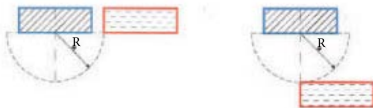
بلوک سایه‌انداز در راستای شرقی- غربی

شکل (۱) استقرار بلوک‌های ساختمانی به تناسب ارتفاع بلوک سایه‌انداز و فاصله تا بلوک مقابل