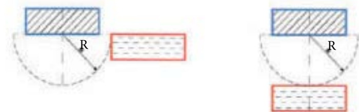
ضلع شمالی بلوک جنوبی در امتداد ضلع جنوبی بلوک شمالی