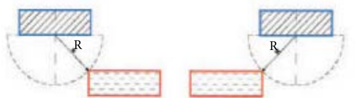
لغزش بلوک سایه‌انداز روی دایره به شعاع R به جنوب شرقی لغزش بلوک سایه‌انداز روی دایره به شعاع R به جنوب غربی